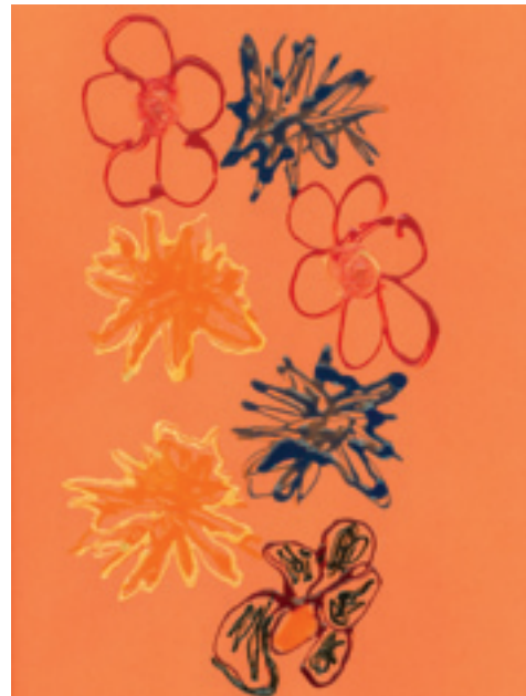
Obrázok nakreslila Tereza s maminkou.